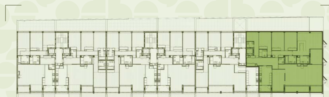
LOCALIZAÇÃO NO EMPREENDIMENTO