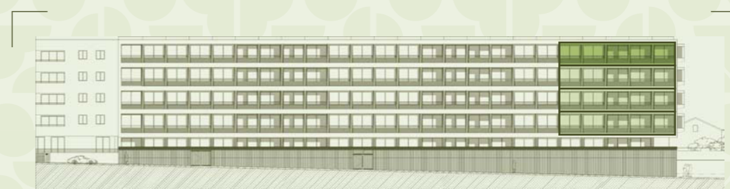
LOCALIZAÇÃO NO ALÇADO