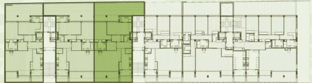
LOCALIZAÇÃO NO EMPREENDIMENTO