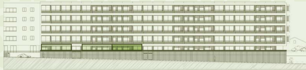
LOCALIZAÇÃO NO ALÇADO