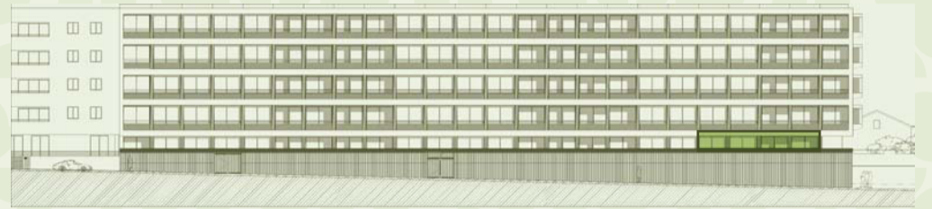
LOCALIZAÇÃO NO ALÇADO