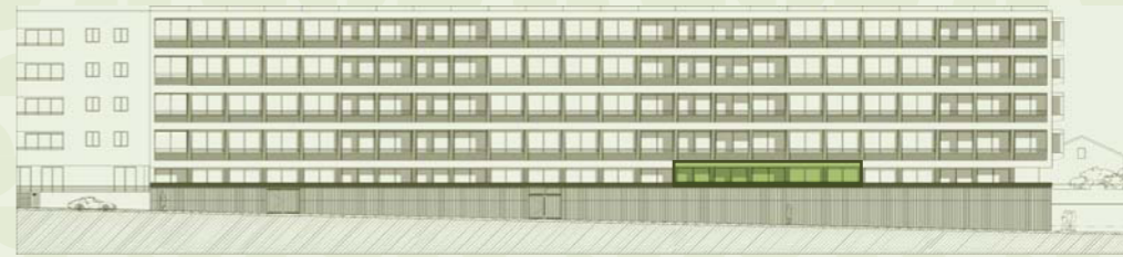
LOCALIZAÇÃO NO ALÇADO